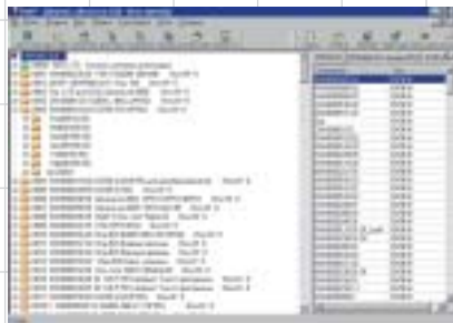
Рис. 2. Фрагмент представления структуры дерева связей объектов в проекте «Архив_ПД»

PartY LT позволяет управлять информацией на одном компьютере с совмещением функций оператора и администратора. Исходя из требований информационной безопасности предприятия вся оперативная информация БД, содержащая программную документацию, должна располагаться на жестких дисках двух компьютеров. При необходимости любой файл, являющийся как бы зеркальным отображением подлинника на первом компьютере, может быть считан со второго компьюте-