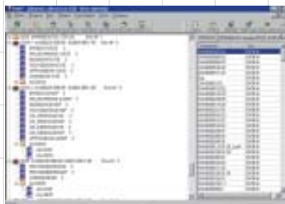
Рис. 4. Фрагмент представления структуры дерева связей объектов типа «конструкторская документация на программное обеспечение» в проекте «Архив_ПД»

Для всех без исключения объектов типа «файловый» введен атрибут «Путь к файлу», обеспечивающий связывание информационной модели данных объектов с соответствующими файлами — метаданными (интегра-