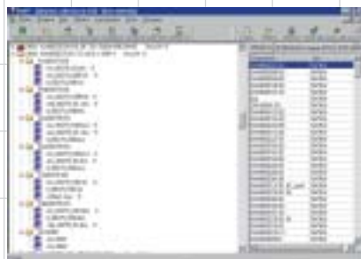
Рис. 3. Фрагмент представления структуры дерева связей объектов типа «программный документ» в проекте «Архив_ПД»

PartY LT позволяет управлять информацией на одном компьютере с совмещением функций оператора и администратора. Исходя из требований информационной безопасности предприятия вся оперативная информация БД, содержащая программную документацию, должна располагаться на жестких дисках двух компьютеров. При необходимости любой файл, являющийся как бы зеркальным отображением подлинника на первом компьютере, может быть считан со второго компьюте-