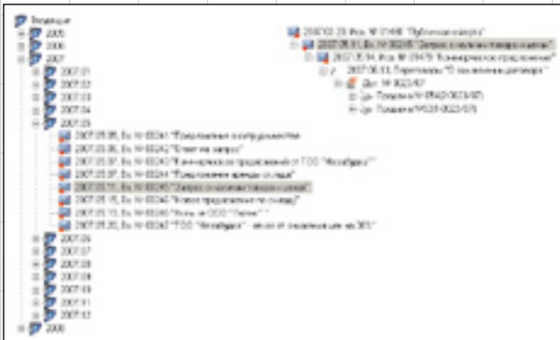
Рис. 1. Один и тот же документ (выделен): регистрация входящей корреспонденции (слева) и история событий

пов подчиненных связей, при этом деревья, построенные по разным типам связи из одних и тех же объектов, выглядят совершенно изолированно, лишней информации нет даже в формах родительских и дочерних объектов. Объекты, имеющие смысл только в данном аспекте, не будут видны при просмотре дерева, построенного по другому типу связи (рис. 1).