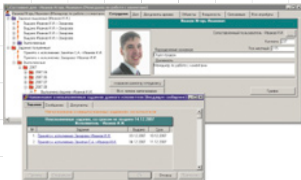
Рис. 2. Сообщение системы напоминаний о приближении срока исполнения заданий сотрудника

пользователь получает информацию о своих очередных задачах, ходе выполнения процессов и состоянии дел путем выполнения соответствующих predetermined или настроенных отчетов. В некоторых случаях вместо отчетов возможно использование форм для дочерних, родительских или связанных объектов, а также форм этапов работ. В последнем случае один из распространенных вариантов — заносить в ходе выполнения процесса требуемую информацию в глобальные переменные работы. Текущие значения указанных переменных (в большинстве случаев применяются массивы) могут просматриваться контролером в форме задачи.